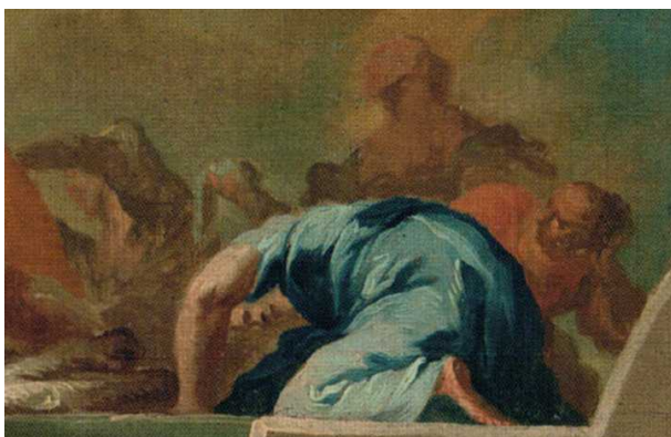
Fig.1: „Tod der Dido“ (Detail von Nr.13).