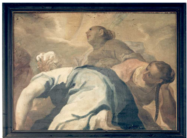
Fig.2: FJ.Spiegler: „Tod der Dido?“, um 1740. Fragment eines Deckenbildes, Schloss Syrgenstein/Lkr. Lindau.

Monographie von 2007 energisch abgelehnt wurde. Bei dieser Sachlage fragt sich der Rezensent, ob die Skizze vielleicht nicht erst um 1770 (die Datierung um 1700 ist schon